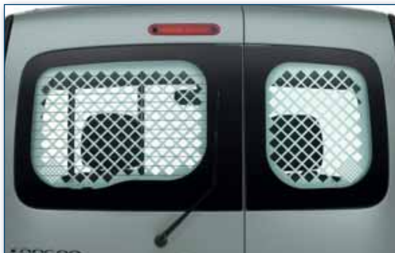
Zaščitna mreža na steklu