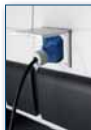
Električni vklop 220 V