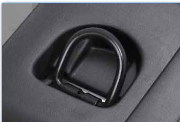
Pritrdilne sponke na podu