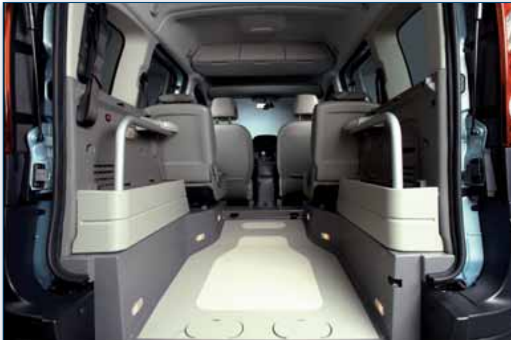
Ureditev notranjosti vozila