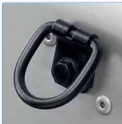
Pritrdilne sponke na stranici